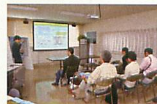
大気汚染テレメータシステム