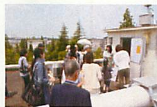
黄砂観測システム